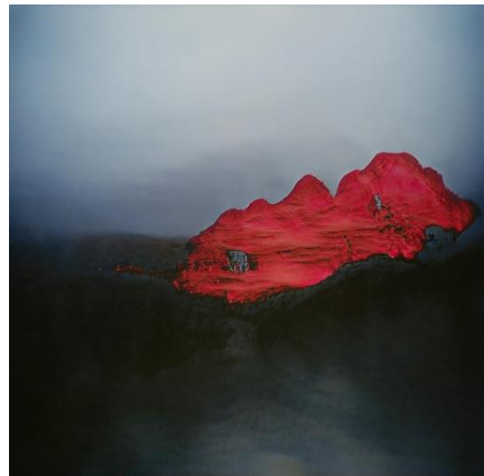
右：《Time Tunnel 01Sep》2020年 ファブリックにUVインクジェットプリント 200×200cm