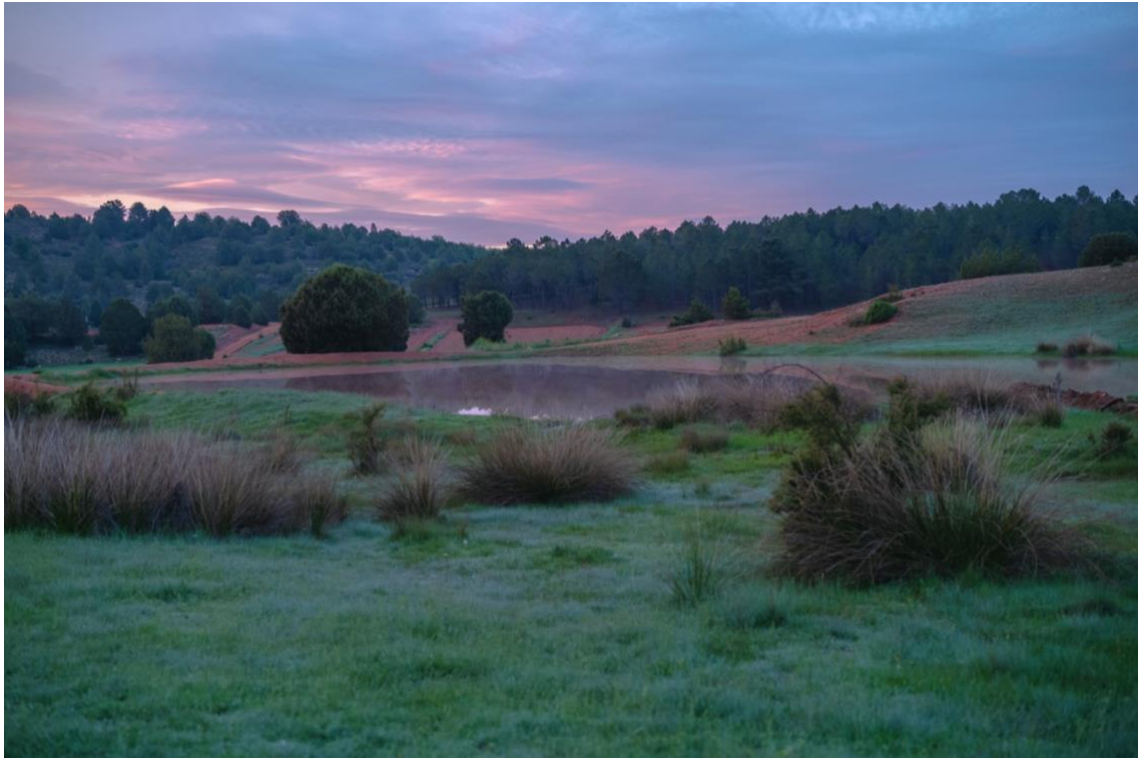
《+34_Teruel_006》2018年 ジクレープリントをアルミマウント 150×225cm (「TRANSLATOR」シリーズより、撮影地：スペイン・テルエル)