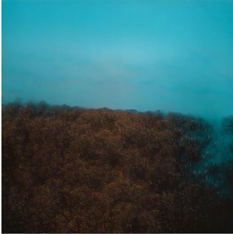
《Time Tunnel 03June》2020年 ファブリックにUVインクジェットプリント 250×250cm（「Time Tunnel」シリーズより）

2021年1月9日（土）から1月24日（日）まで、オンザヒルは映画や商業フィルム、ミュージックビデオを中心に手がける映像作家・写真家の柿本ケンサクによる新作展